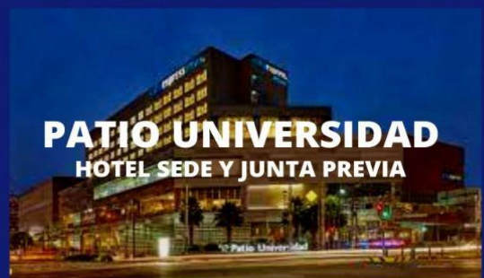
PATIO UNIVERSIDAD HOTEL SEDE Y JUNTA PREVIA